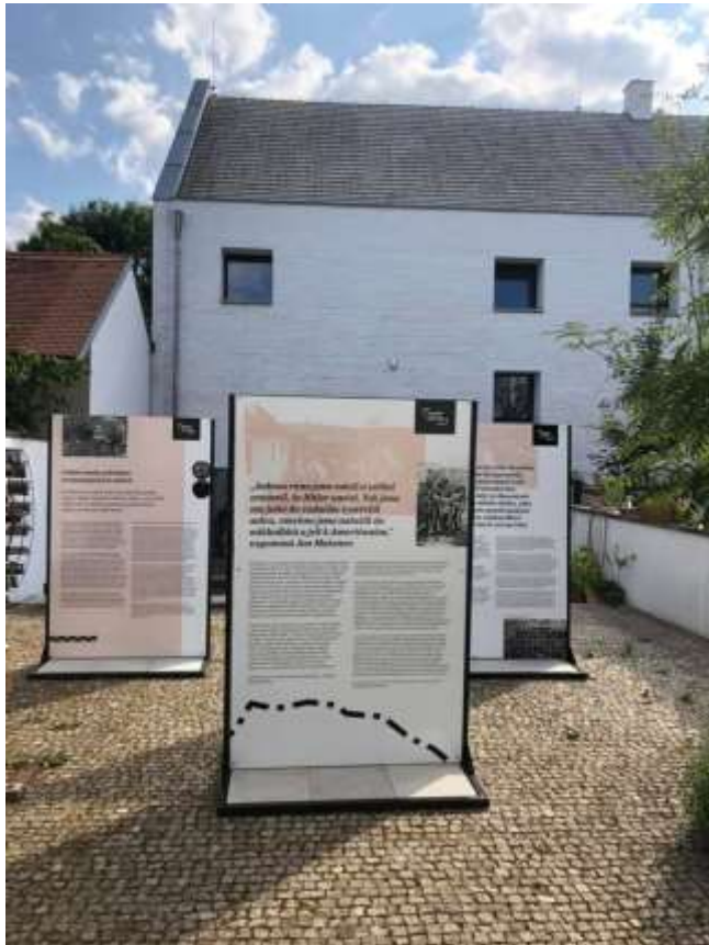
Výstava Křižovatky konce války (ve spolupráci s Pamětí národa JČ Kraje)

Dále předkládáme výčet aktivit SR, o.p.s. V ROCE 2021 podle činností stanovených Zakládací listinou.